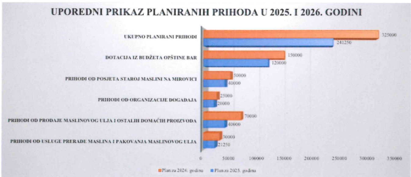
Ilustracija 4: Usporedni prikaz planiranih prihoda u 2025. i 2026. godini

*Prihodi od prerade maslina, kao i od usluge punjenja maslinovog ulja, te prodaje maslinovog ulja u ugostiteljskim objektima i trgovačkim lancima isključivo zavisi od dinamike realizacije nabavke, instalacije i puštanja u rad linije za proizvodnju maslinovog ulja u mašinskom pogonu Kuće maslina, te od visine roda masline u crnogorskom arealu uzgoja. Važno je napomenuti da u prihodnoj strani jjesu planirana bespovratna grant sredstva, s obzirom da ocjenjivanja grantodavaca značajno kasne na regionalnom nivou i ne mogu biti siguran oslonac za planiranje prihoda preduzeća.