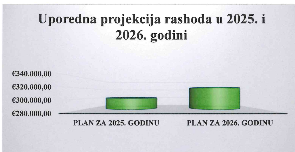
Ilustracija 5: Uporedni prikaz planiranih rashoda u 2025. i 2026. godini

Za realizaciju mjera predviđenih Programom upravljanja Spomenikom prirode: „Stablo Stare masline ( Olea europaea L. ) na Mirovici“ za 2026. godinu, potrebna sredstva će biti obezbijedena kroz redovno