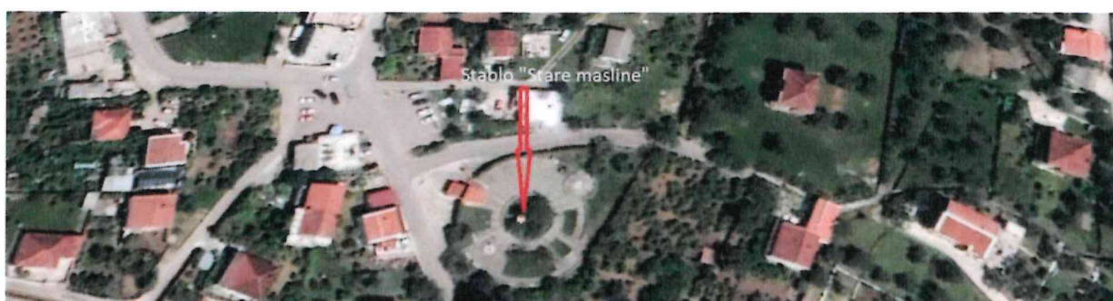
Ilustracija 2: Geografski položaj Stare masline